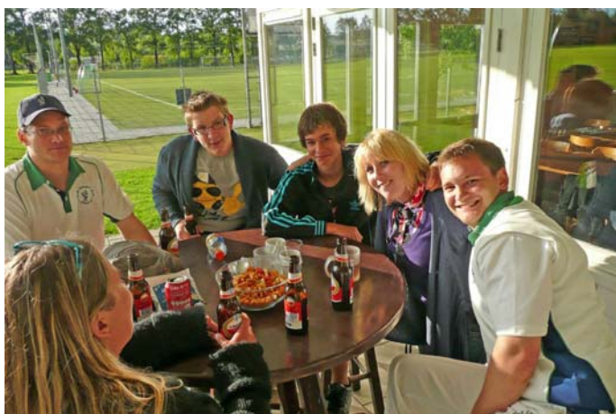
Na de wedstrijd was het erg gezellig. Hier wachten spelers, partners en kinderen op het heerlijke Indisch eten van onze sponsor Bombay Spice. Er was een lopend buffet met heerlijke gerechten. Iedereen heeft gesmuld!